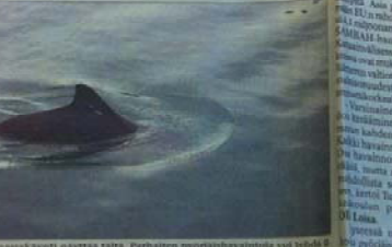
Pyöriäinen pyöriäinen pinnassa käyvä näyttaa tältä. Parhaiten pyöriäisiä havaitaan nyt vesillä.

Alueen Suomessa tavattava valaslaji pyöriäinen on vaarassa hävitä kokonaan. Vain 1980-luvun alkupuolella pyöriäisiä havaittiin Suomen rannikoilla usein, mutta tilanne on viimeisten vuosikymmenten aikana kehittyneet huolestuttavasti.