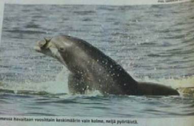
Suomessa havaitaan vuosittain keskimäärin vain kolme, niitä pyöriäisiä.