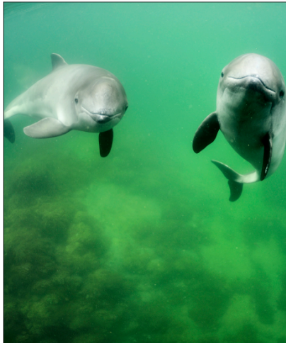
Tumlare i farten. Det finns några få av dem kvar i Östersjön, men där är de hotade, om inget görs för att rädda dem.