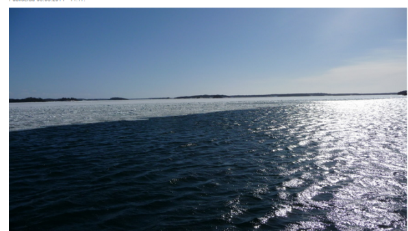
Med hjælp av avlyssningsapparater på havets botten har forskarna samlat in information om tumlare.

Nu har man klart kunnet visa att tumlare finns i merparten av Östersjön ända upp till Åland och Skärgårdshavet. Observationerna gjordes inom ramarna för ett internationellt tvåårigt forskningsprojekt.