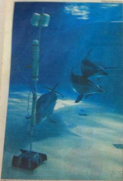
Oliittit toimivat kokeiluna Itämeren vedenalaisen pyöräisten kuunteluverkoston toteutuksessa SÄK-tutkimuksen ohjelmassa.

Tutkimuslaitosten ja yliopistojen yhteistyöllä pyöräisten kuunteluverkosto alkaa toimia. Itämeren pyöräisten kuunteluverkoston perustaminen on yksi Suomen ympäristöministeriön ja SAK:n yhteisestä tutkimusohjelmasta. Verkoston avulla pyöräisten ääniä voidaan seurata laajalla alueella. Verkoston perustamiseen osallistuu useita tutkimuslaitoksia ja yliopistoja. Verkoston avulla pyöräisten ääniä voidaan seurata laajalla alueella.