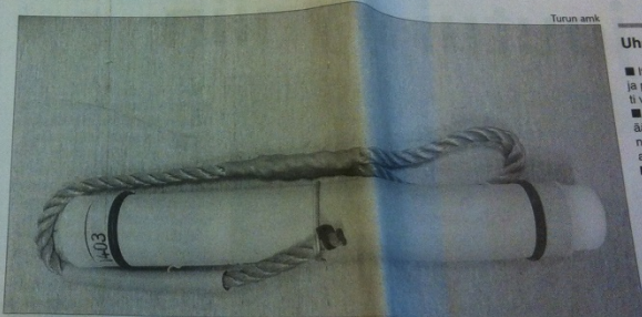
Itämeren upotetaan keväällä 300 tutkimuslaitetta, joilla talloidaan pyöriäisten ääniä.

Pyöriäiset ääntelevät delfiinin tapaan ultraäänellä, jota ihmiskorva ei voi kuulla. Tutkimuslaitteet havaitsevat ja rekisteröivät pyöriäisen kaikuluotausääniä noin sadan metrin säteeltä laitteesta. Laitteet sijoitetaan merenpohjaan 5–80 metrin syvyysselle vesialueelle. Laitteet on tarkoitus uppottaa