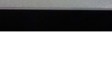
Pyöriäinen pyöriäinen pinnassa käyvä näyttaa tältä. Parhaiten pyöriäisiä havaitaan nyt vesillä.

Alueen Suomessa tavattava valaslaji pyöriäinen on vaarassa hävitä kokonaan.